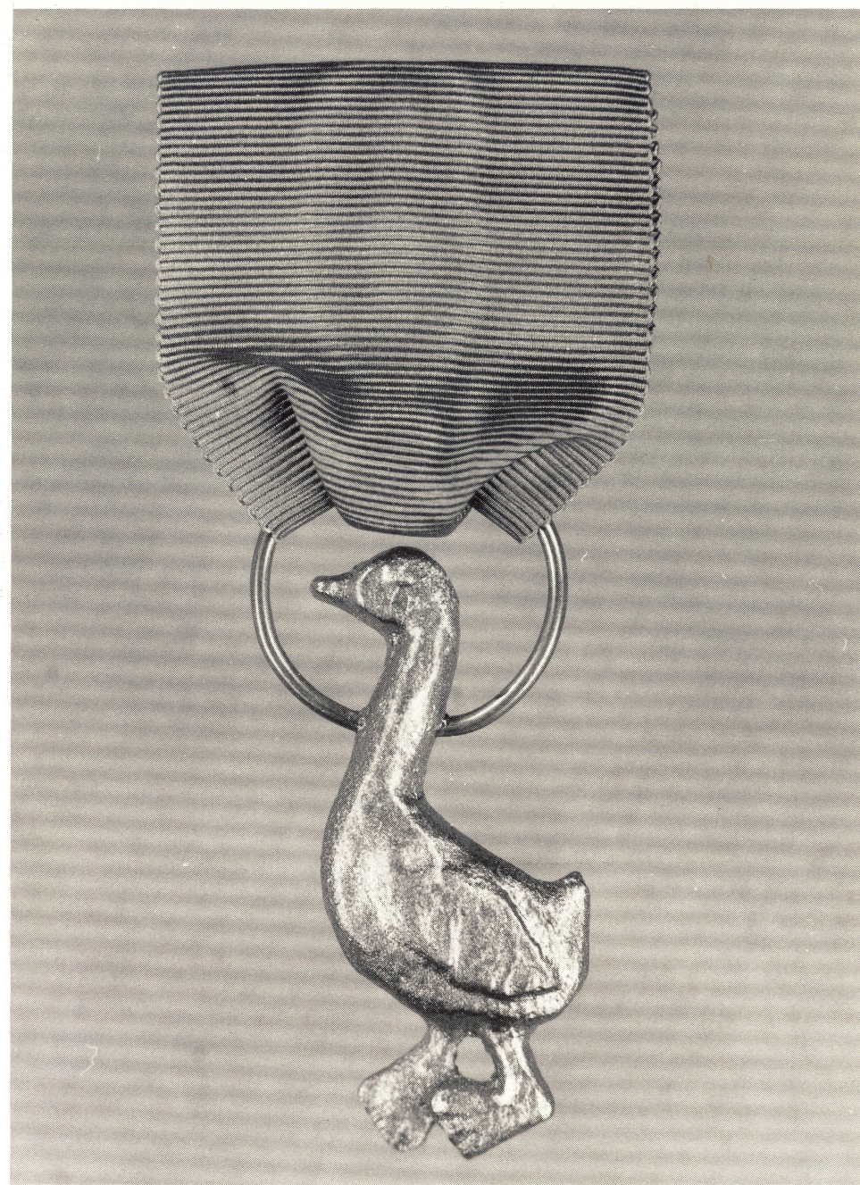
Skånegillet i Göteborg S:t Martins Orden. Instiftad 1952. Skulpterad, gjuten och skänkt av Carl-Axel Lindbom.