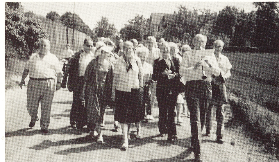
Vandring till lunch på Hven 4/6 1978.

1978 gick bussen till västra Skåne. Medhavd lunch åts på Åldermansparets vackra sommarställe Svanshall, Jonstorp. Efter ett besök på Sofiero slottsträdgård skedde inkvartering på Örenäs slott med senare middag och dans. På söndagsmorgonen tog man sig via Råå över till självaste Hven, som upplevdes med hjälp av guide och även med taxiresor. De ansträngande promenaderna livades genom att v. åldermannen gick i täten och på klarinett spelade marscher och låtar. Efter en förträfflig lunch på Smedjegården gick bussen från Råå till Göteborg. Detta gav tydligen mersmak, ty redan nästa år for man, för omväxlings skull i egna bilar, till Norrvikens trädgårdar, Båstad; efter avnjutande av florans skönhet avnjöts egen lunch på gräset. Övernattning skedde på Rusthållaregården i Arild, men festmåltiden och dansen ägde rum hos Åldermansparet i Svanshall. Klokt nog användes därvid minibuss, men nästa dag gick de egna bilarna via Helsingborg till Helsingør. Botaniska studier fortsatte på Hørsholms Planteskole. Sedan besöktes Sorgenfri Slot, där prinsessan Caroline Mathilde å det älskvärdaste mottog gillesmedlemmarna och informerade om komplicerade historiska händelser samt bjöd på förfriskningar. Lunch åts senare (med prinsessan som gilletts gäst och som privatperson) på Restaurant Le Port, Espergaerde, varefter hemresan började (vågar man skriva hem , när man far från Skåne?).