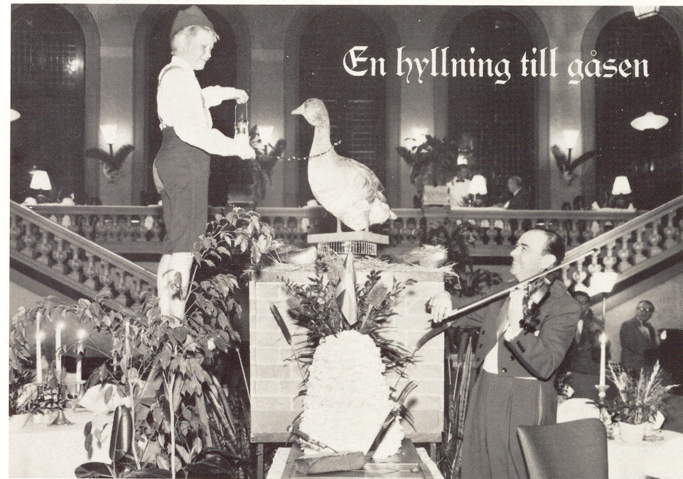
Kupolhallen Grand Hotel Haglund omkring 1960.

Gåsfesterna ägde under åren 1901–1911 rum på Frimurarelogens restaurang, alternativt på Phoenix eller Öster. 1914–1917 blev det Palace, 1918 omintetgjorde spanska sjukan gåsfesten (enda gången hittills!). 1919–1928 tävlade tydligen Palace och Grand om äran (och förtjänsten). Grand Hotel Haglund vann loppet (kanske för att där en gång varit ett gästgiveri med många stallar?) och hade hand om festen